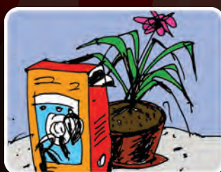
СУХИЕ СЫПУЧИЕ ВЕЩЕСТВА